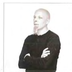
Ontwerper: Bernard Charlier

Ergonomische en zéér goedzittende kapperszetel met drie rugkussens. Kleurenvarianties zijn naar keuze en haast onbeperkt. Verschillende voetstukken zijn beschikbaar. Hoogwaardige kwaliteit gedekt door vijf jaar waarborg.